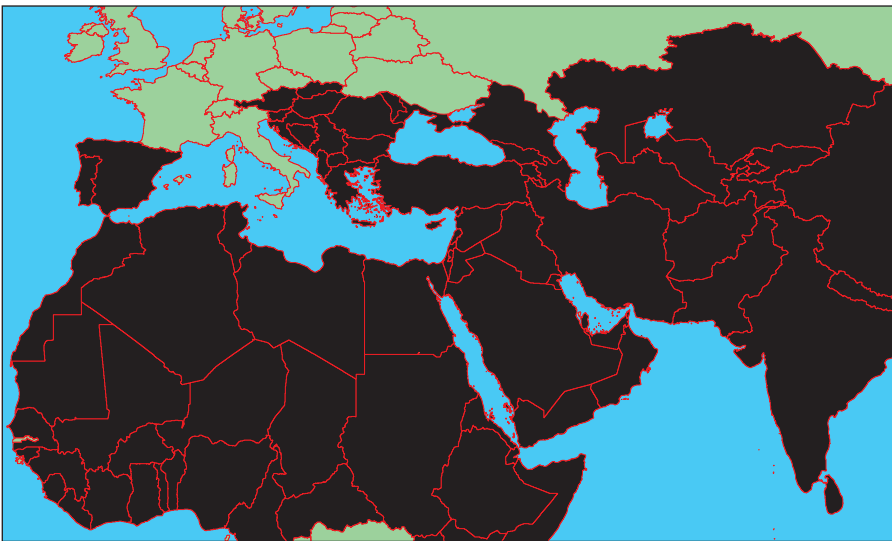
Карта мироустройства ИГИЛ

В настоящий момент группировка контролирует часть территории Сирии, а также ряд провинций в Ираке.