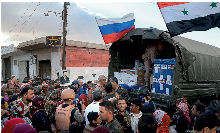
Россия оказывает гуманитарную помощь Сирии.