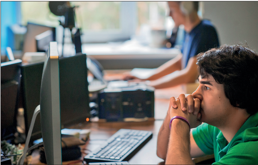
Постоянное присутствие вербовщиков ИГИЛ в соцсетях.

Активисты ИГИЛ поддерживают свои аккаунты в сетях Facebook, Twitter, Instagram, Friendica, Telegram. Активно они заявили о себе и в российских социальных сетях: «ВКонтакте» и «Одноклассниках».