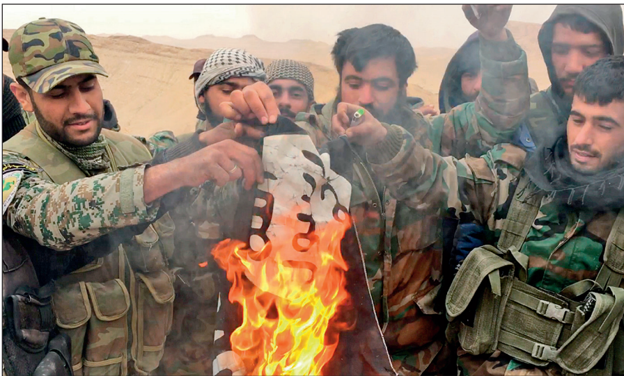
Народные ополченцы САР сжигают флаг ИГИЛ, снятый с отбитой у боевиков цитадели Пальмира.

Современное государство обязано защищать интересы каждого своего гражданина вне зависимости от его расы, национальности, принадлежности к определенной конфессии или религиозной традиции, в то время как ИГИЛ выражает интересы небольшой группы религиозных радикалов, жестоко подавляя остальную часть населения посредством запугивания, насилия и террора.